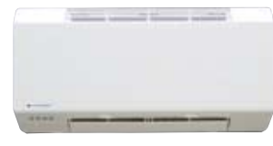
コードレスリモコン