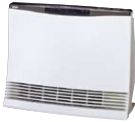
コードレスリモコン

HH-5306AME-RT 希望小売価格 94,500円 (税抜90,000円)