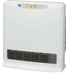
コードレスリモコン

FH-3508AME-RT 希望小売価格 75,600円 (税抜72,000円)