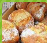
●ドルチェヴィータ