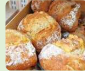
●ドルチェヴィータ