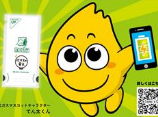
北ガスマスコットキャラクター てんたんくん