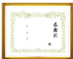
小学校への感謝状 （額入り・1枚）