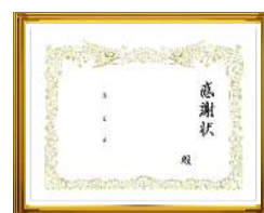
小学校への感謝状 (額入り・1枚)