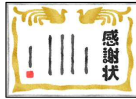
全児童へのミニ感謝状