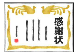
全児童へのミニ感謝状