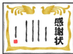
全児童へのミニ感謝状