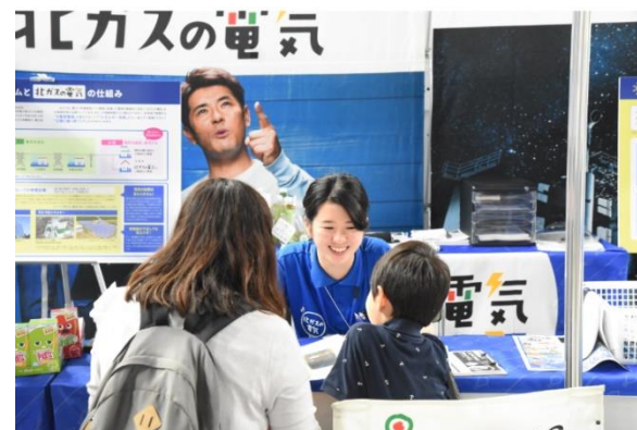
環境広場さっぽろ(8月12日・13日)