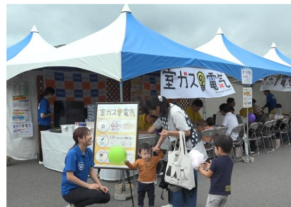
室蘭ガスイベント(9月14日・15日)