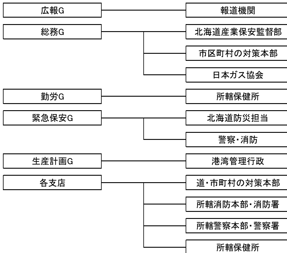
別表3 防災関係機関との情報連絡経路