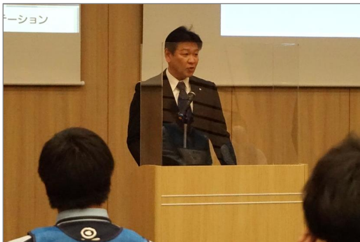
前谷常務の開会挨拶（北ガスグループ本社ビル（札幌）にて）