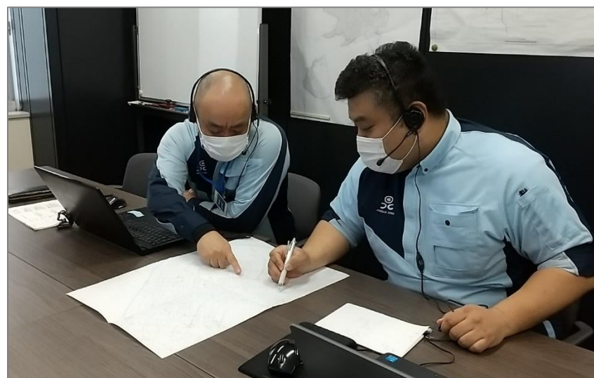
北ガス千歳支店保安センター