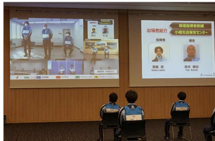
本社ビルと各拠点をオンラインで中継