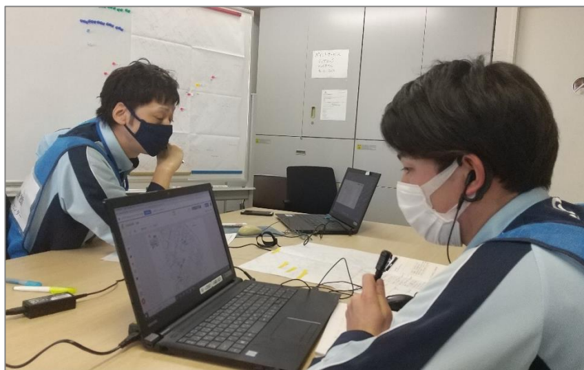
北ガス函館支店保安センター