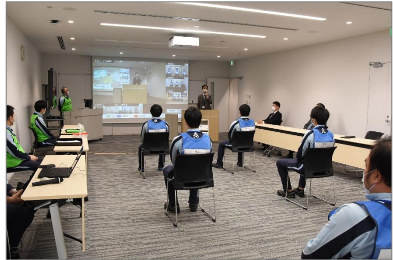
大関事業部長の閉会挨拶（北ガスグループ本社ビル（札幌）にて）