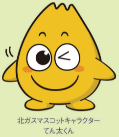
北ガスマスコットキャラクター てん太くん